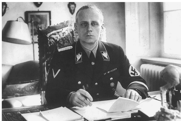
Иоахим фон Риббентроп.

но это было за год обусловлено Тильзитским мирным договором, кроме того, такое же соглашение было подписано между Парижем и Лондоном в 1915 году и предусматривало раздел Турции. То, что там было прописано, сохранилось до наших дней, существование Ирака, Сирии, Ирана, Иордании, Палестины — это всё было в секретном договоре между